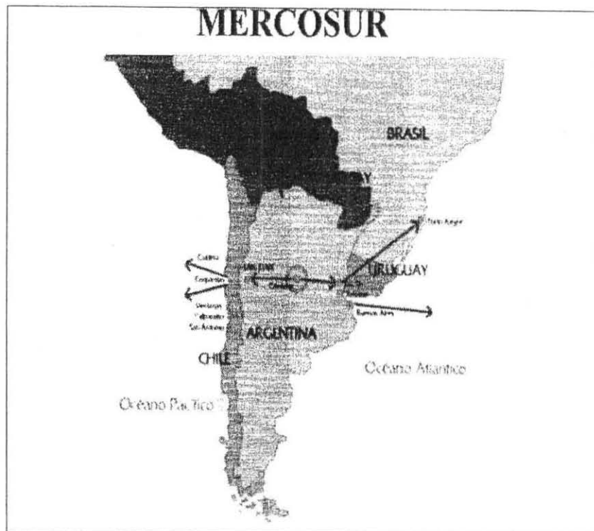
Trazado del Corredor Bioceánico Central

Así mismo señala la existencia de “una brecha de desarrollo considerable de las zonas constitutivas del Corredor Bioceánico Norte respecto del Corredor Bioceánico Central y por ello resulta necesario definir líneas estratégicas de abordaje superadoras de la problemática regional y su integración a áreas de mayor desarrollo relativo”.