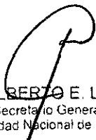
Dra. SILVIA N. BAREI VICERRECTORA UNIVERSIDAD NACIONAL DE CÓRDOBA