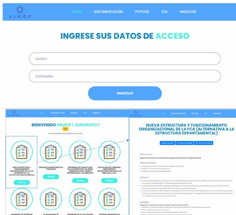
Figura 2: Sistema online SiMEP, para la carga de los avances del PDI.